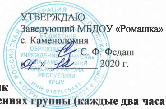
График дезинфекции поверхностей в помещениях группы (каждые два часа)

Приложение № 20 к приказу от 01.12.2020 № 163