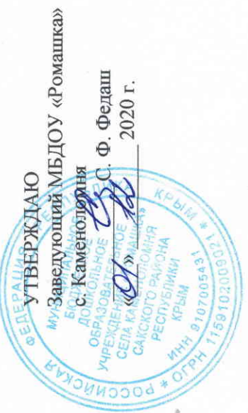
ГРАФИК ГЕНЕРАЛЬНЫХ УБОРОК МБДОУ «Ромашка» с. Каменоломня