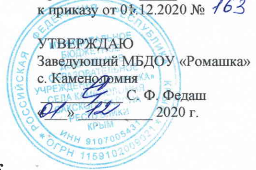
График дезинфекции поверхностей помещений прачечной (каждые два часа)

Приложение № 18 к приказу от 01.12.2020 № 163