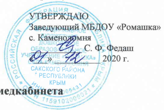
График уборки медкабинета