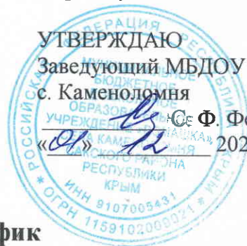
График работы рециркуляторов в групповых помещениях