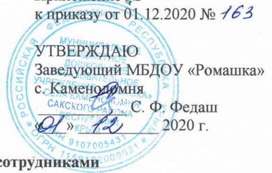
График смены масок сотрудниками

Приложение № 4 к приказу от 01.12.2020 № 163