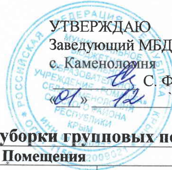
График влажной санитарной уборки групповых помещений