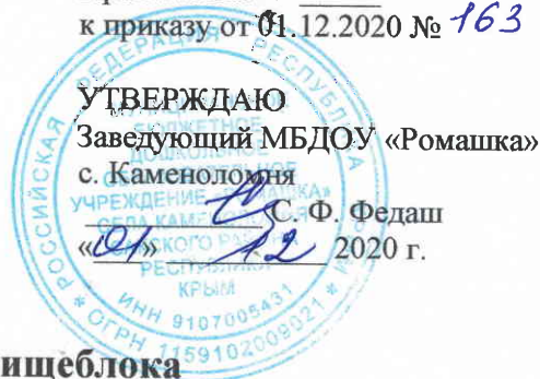
График уборки пищеблока