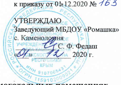
График влажной санитарной уборки во вспомогательных помещениях